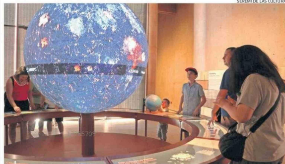
SEREMI DE LAS CULTURAS

El concejal se defendió y en conversación con este medio dijo que la denuncia del funcionario ante Carabineros es "algo político para acallar la voz del pueblo", agregando que "no me van a callar porque fui elegido por la gente". Pág. 3