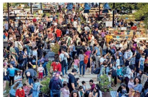
© Más de 6 mil asistentes participaron de la 3ra Feria del Libro "Ilumina el pensamiento" de la Universidad San Sebastián.