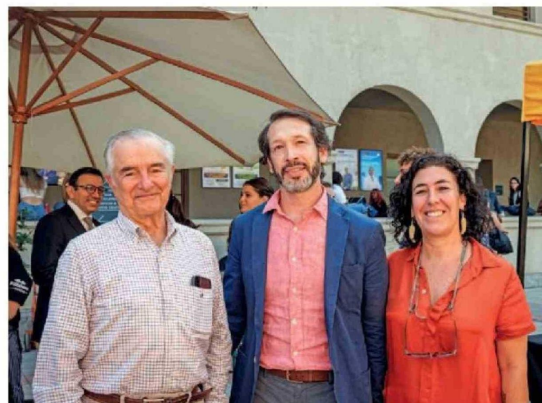
© Dr. Manuel José Irarrázaval , integrante del Instituto de Políticas Públicas en Salud USS; José Tomás Cordero , miembro de la Junta Directiva USS; y Daniela Correa , jefa de Extensión Cultural USS.