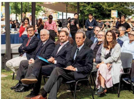
© Inauguración 3ra Feria del Libro USS.