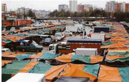
FERIAS: ¿INCREMENTO PROMEDIO DE $500 PESOS EN PRODUCTOS?

A su juicio, los esfuerzos de recorte fiscal “afectan de manera negativa en el corto plazo a la economía, pero si el Gobierno logra mejorar las finanzas públicas se podría ver un impacto positivo en el mediano plazo”. Ahora en cuanto al conflicto internacional, “entre más rá-