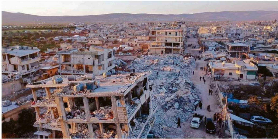
GUERRA EN MEDIO ORIENTE ESTÁ FRENANDO LA ECONOMÍA MUNDIAL, AL DISPARAR LA INFLACIÓN POR ALZAS EN PETRÓLEO Y GAS.