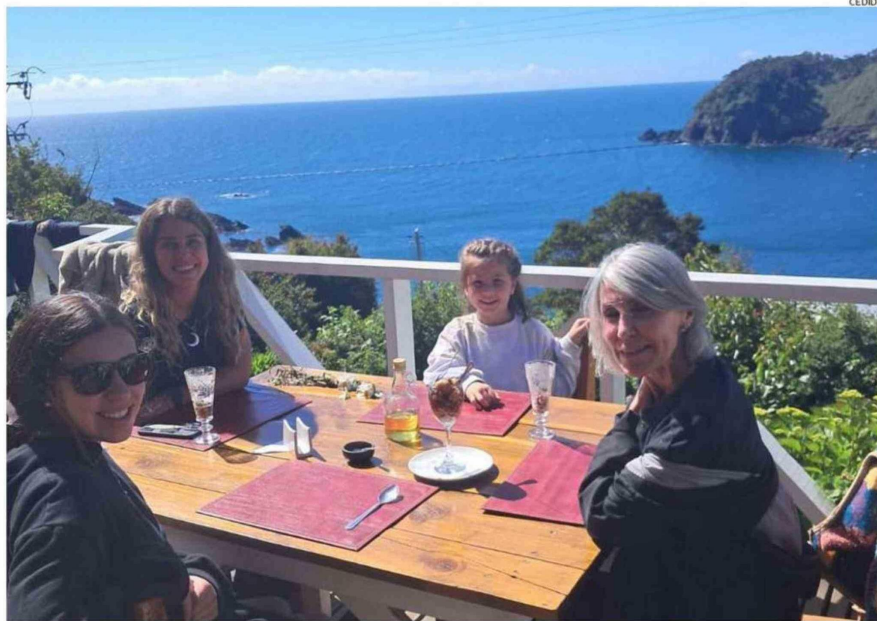
TURISTAS DISFRUTAN DE LA VISTA DEL OCEANO PACIFICO DESDE LAS TERRAZAS DE HOSTERIA LA CASA DEL MAR, UBICADA EN BAHIA MANSA.