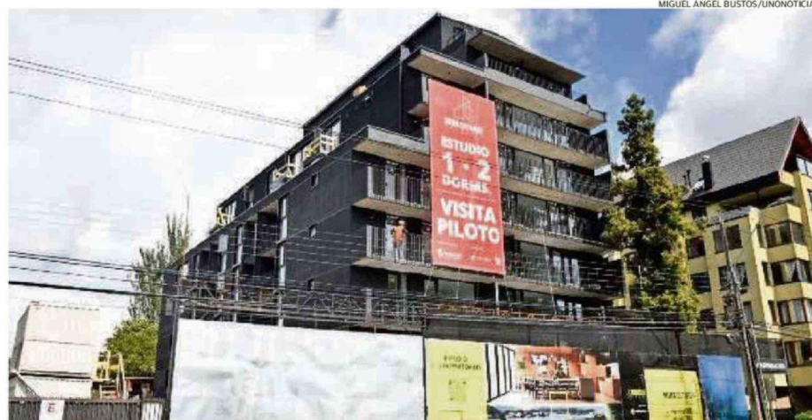
PARA LA CÁMARA CHILENA DE LA CONSTRUCCIÓN, LOS MÁS AFECTADOS POR PROBLEMAS DE ACCESO A VIVIENDAS SON LOS SECTORES MEDIOS.

Una tercera idea es la prórroga de permisos de edifica-