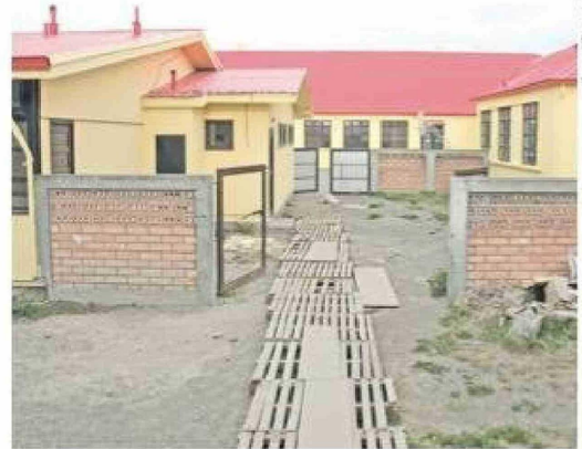
La Escuela Bernardo O'Higgins, que sufre hacinamiento, forma parte de las iniciativas que esperan recibir aportes del Pedze en Porvenir.

mirada de un Estado centralista y sin visión”. Estimó que “estas acciones inconsultas, muestran claramente el distanciamiento del actual ejecutivo con los gobiernos regionales”, que a su juicio “es un retroceso gigante en cómo se ve el Estado de Chile”.