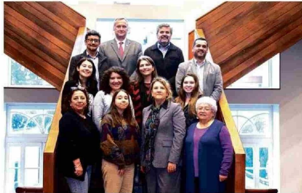
El Consejo de Sustentabilidad articula el trabajo de la UCT en estas materias.

Así es como en los últimos años se han inaugurado diversos edificios con sello verde, entre ellos el Pabellón Docente y el Campus Nuestra Señora de Lourdes (que alberga el Hospital de Simulación), espacios que reflejan cómo la universidad ha ido adaptan-