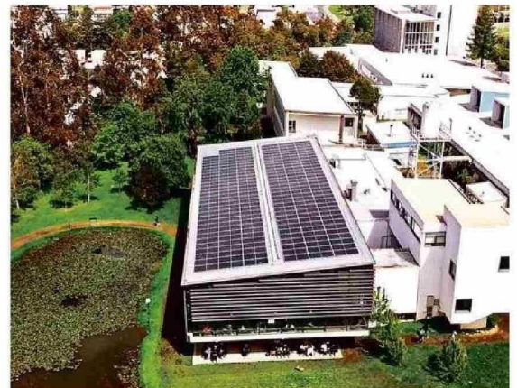
El campus San Juan Pablo II con sus paneles fotovoltaicos.

“Buscamos dejar una huella en cada estudiante, académico y trabajador promoviendo una cultura donde todos y todas se reconozcan como agentes de cambio”