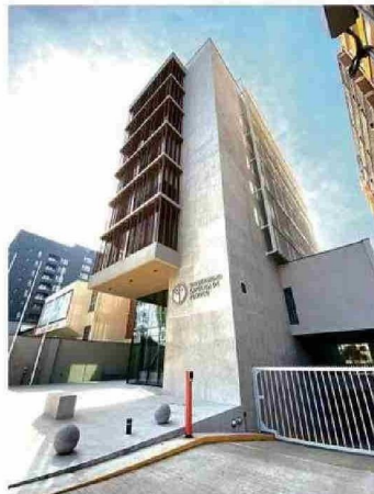
Campus Nuestra Señora de Lourdes.