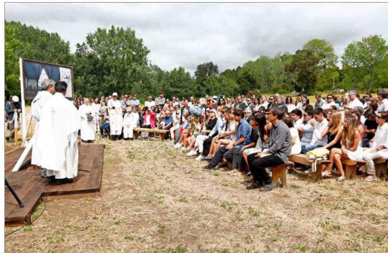
Primera piedra Luego de la misa, hubo una ceremonia para dar inicio a la edificación de la futura capilla Nuestra Señora de Fátima, que la Fundación Piñera Morel construirá en la localidad.

Unas 250 personas llegaron a la ceremonia realizada ayer en Bahía Coique: