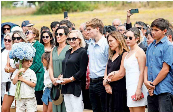
La familia Piñera Morel encabezó la ceremonia. En la imagen, la ex primera dama Cecilia Morel, sus hijas Magdalena y Cecilia Piñera, y nietos del exmandatario.

Tiraje: 126.654 Lectoría: 320.543 Favorabilidad: No Definida