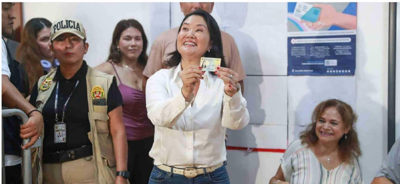
► La candidata presidencial Keiko Fujimori de Fuerza Popular emite su voto en el distrito de San Borja durante la jornada de las Elecciones Generales 2026.