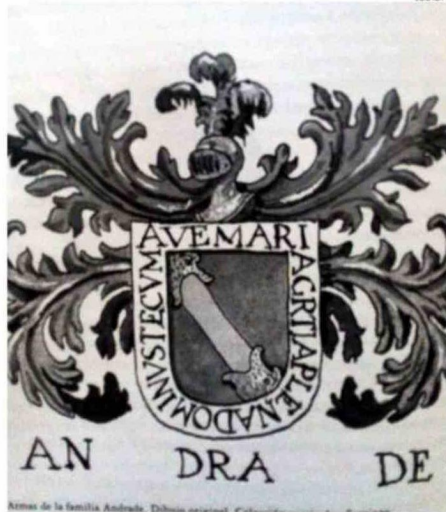
ESCUDO DE ARMAS DE LA FAMILIA ANDRADE, TÍPICA DE CHILOÉ.