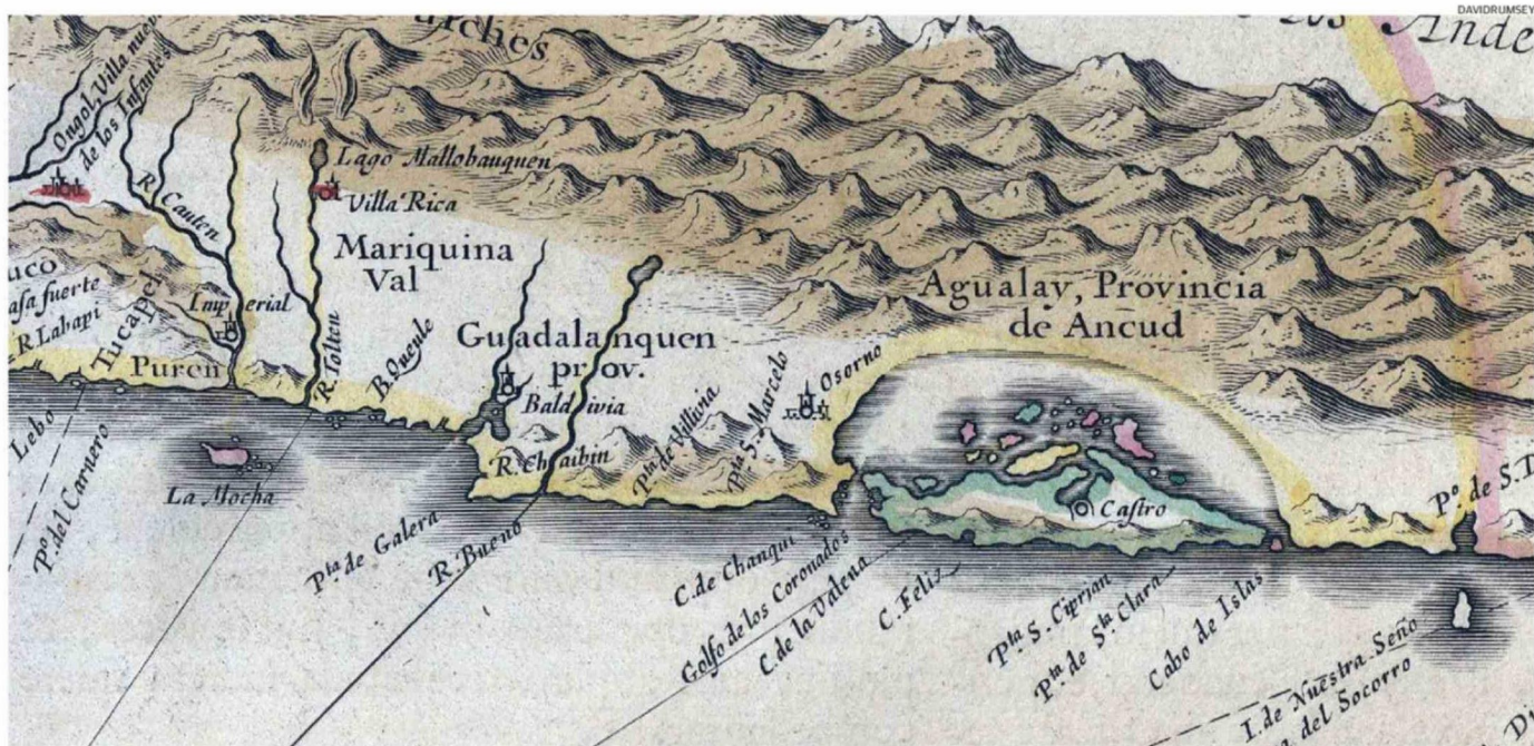
EN EL DETALLE DEL PLANO DE CHILE, ELABORADO POR JOAN BLAEU EN 1662, SE OBSERVA LA ISLA DE CHILOÉ, CON LA CIUDAD DE CASTRO BIEN IDENTIFICADA, AL IGUAL QUE OSORNO, PESE A QUE YA ESTABA DESTRUIDA.

Tiraje: 4.500 Lectoría: 13.500 Favorabilidad: No Definida