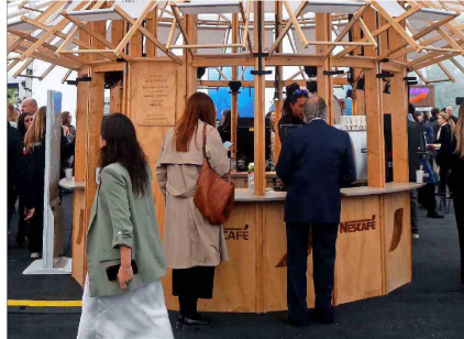
Junto al espacio principal, el evento también cuenta también con un sector de stands.