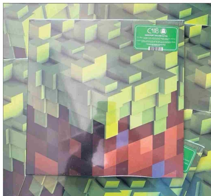
CAPTURA DE PANTALLA

clientes, pero también tenemos timbres, llaveros, peluches y una mochila que ha sido todo un éxito. En nuestro sitio online, además, ofrecemos un surtido aún más amplio que incluye vestuario, el cual se agotó rápidamente en tiendas”. La colección de peluches tiene 12 figuras, entre ellos zombies, Creeper y Plush Pig. Los precios van desde $13.990 a $29.990 ( https://acortar.link/S38msE ).