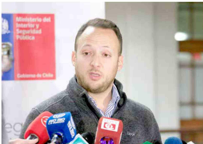
Abogado, egresado de la Universidad de Talca, ejerció hace unos años como secretario general de Gobierno en la Región del Maule.