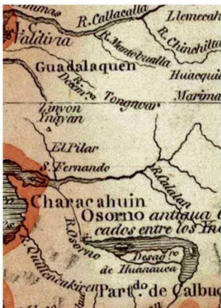
DETALLE DE UN PLANO DE 1799 DE LA ZONA DE LOS LLANOS.

cuenta del Rey. Dos años más tarde, en 1792, podían notarse algunos modestos progresos, con 100 neófitos y 601 gentiles en Dagllipulli. Para 1803, la cantidad de indígenas convertidos al cristianismo había subido a 606 en Dagllipulli y 400 gentiles”, señala Ximena Urbina.