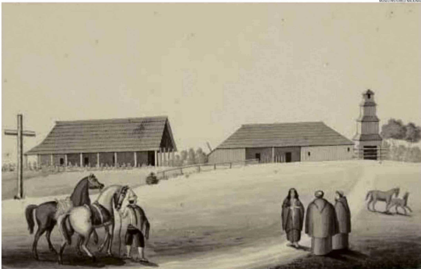
GRABADO DE RODULFO PHILIPPI DE LA MISIÓN DE DAGLLIPULLI EN 1852. LAS CONSTRUCCIONES ERAN MADERA RÚSTICA, TANTO LA CAPILLA COMO LA CASA DE LOS MISIONEROS Y DEMÁS DEPENDENCIAS.