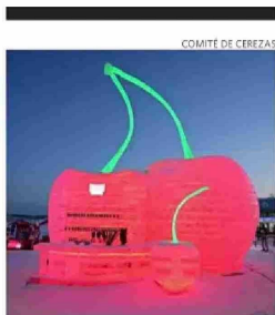
COMITÉ DE CEREZAS 87% de las cerezas se exportaron a China en 2025-2026.