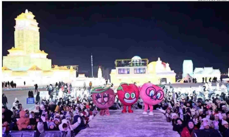
El Comité de Cerezas de Frutas de Chile apuesta a desarrollar el consumo del producto en ciudades del interior de China.