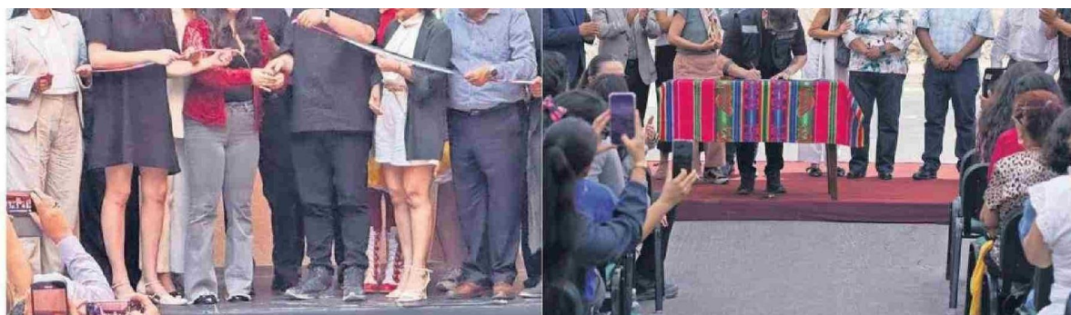
EL MANDATARIO CORTÓ LA CINTA PARA INAUGURAR EL NUEVO MUSEO REGIONAL EN COPIAPÓ, HORAS ANTES FIRMÓ EN DIEGO DE ALMAGRO EL DECRETO PARA AMPLIAR LA RED DE SALARES.

las 12.20 horas de ayer el Presidente Gabriel ribó a Diego de Alma- ia una camisa negra de orta, un smartwatch ás miró) y una chaque- ga corta con el logo del o. Además, para prote- sol y la alta temperatu- esa hora superaba los s gafas negras, estilo r, que le daban un as- tre outdoor y rockero, a la locación escogida equipo de avanzada. s bajo un toldo blanco, e la sede de la Comuni- a Diego de Almagro, lo un un centenar de per- tre autoridades, polí- gionales, comunales, tas y miembros de la lad local. a expectación. Más allá vo de la visita, como na de los decretos que ersas áreas protegidas co de la Red de Salares os en la región de Ata- ta fue la primera visita