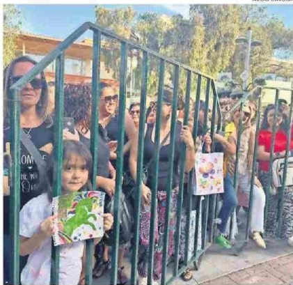
UNA NIÑA ESPERABA AL PRESIDENTE PARA ENTREGARLE UN DIBUJO.