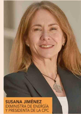
SUSANA JIMÉNEZ EXMINISTRA DE ENERGÍA Y PRESIDENTA DE LA CPC