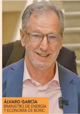
ÁLVARO GARCÍA EXMINISTRO DE ENERGÍA Y ECONOMÍA DE BORIC

Si bien estos productores eléctricos dejaron sentir su rechazo de inmediato, en el marco del reciente ChileDay 11 firmas generadoras de capitales europeos y estadounidenses (todas PMGD) arremetieron enviando una carta al ministro de Hacienda,