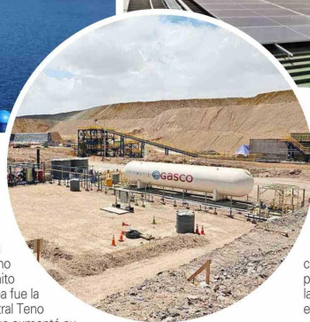
Planta GASCO de calentamiento de pilas de lixiviación.

establecimientos educacionales, clínicas, hospitales y minería— incorporen energías renovables a su consumo eléctrico.