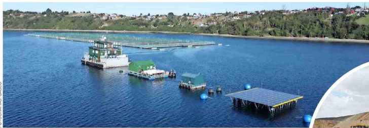
Generación eléctrica con gas licuado + ERNC, en industria salmonera, Región de los Lagos.

Con el firme propósito de facilitar los sueños de las personas dando acceso a la mejor energía, mediante soluciones innovadoras y a la medida de sus necesidades, Empresas GASCO está impulsando un modelo responsable que busca crear valor económico, social y ambiental de largo plazo, y que abarca desde su negocio base de distribución de gas licuado, hasta proyectos solares y de