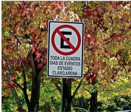
VEHÍCULOS —Vecinos de la zona reclaman por la gran aglomeración de automóviles que ocurre en las cercanías al estadio durante cada evento.

El historial de estos encuentros reactiva temores por congestión, seguridad y alteraciones en la vida del barrio. Residentes definen el estadio como “un vecino molesto”.