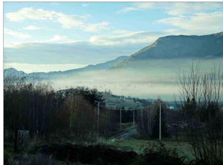
COYHAIQUE. —Subsidiar focalizadamente el uso de leña es una alternativa en zonas muy contaminadas en el sur, como ocurre en Aysén.

“Y claro, con la cuenta de la luz, que quieren que la gente use. No solo en Santiago, sino también en