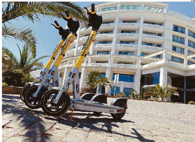
VEHÍCULOS ESTARÁN DISPONIBLES EN GRAN PARTE DE LA CIUDAD. MUNICIPIO PIDE CUIDAR DISPOSITIVOS.

Desde la empresa destacan que se dispondrán inicialmente 500 dispositivos a repartir en 75 aparcaderos. "Estamos abarcando el territorio de playa Las