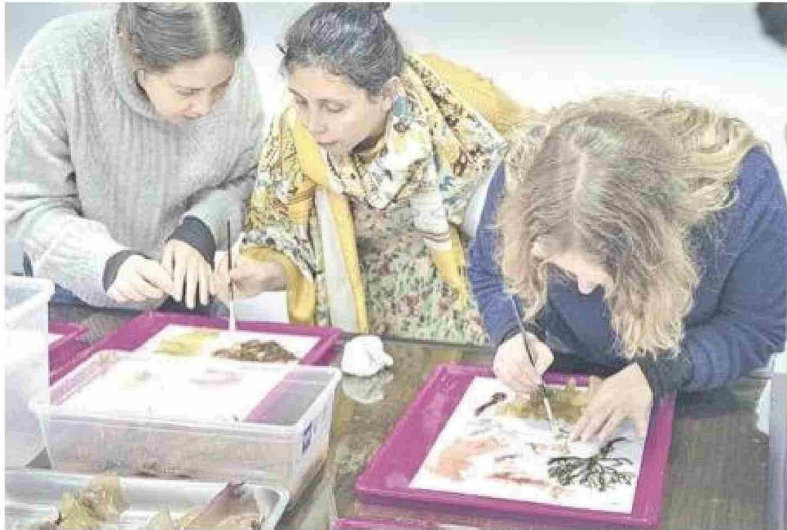
El herbario más austral del mundo funciona como una verdadera biblioteca de la biodiversidad patagónica y antártica. Allí se resguarda patrimonio natural que sirve para investigación, educación y divulgación científica, permitiendo identificar especies, reconstruir cambios ecológicos y fortalecer el conocimiento sobre ecosistemas frágiles y poco explorados.