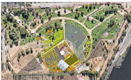
DIRECCIÓN DE ARQUITECTURA MDP.

Los bocetos para este templo los regaló el arquitecto catalán en 1922. Tras intentos fallidos, hoy se espera avanzar con la ley de donaciones.