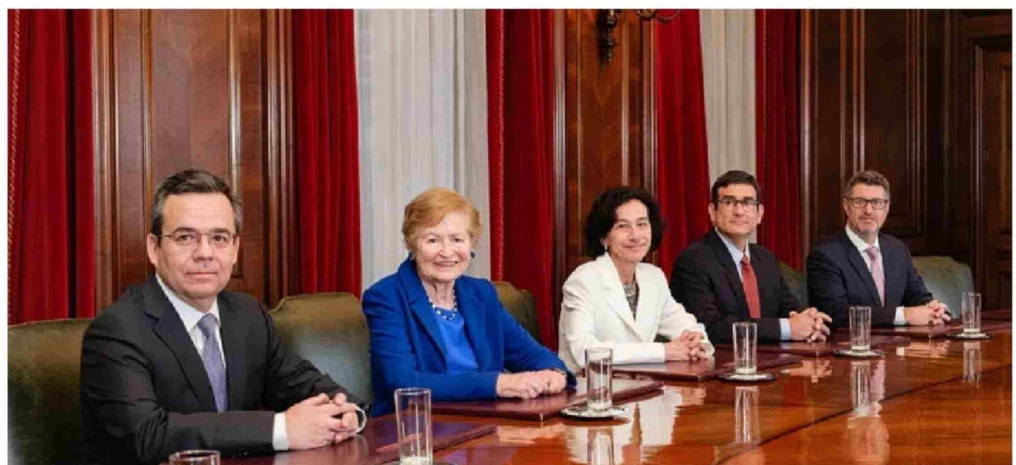
SIGUE El consejo del Banco Central es presidido por Rosanna Costa (en la foto al medio).