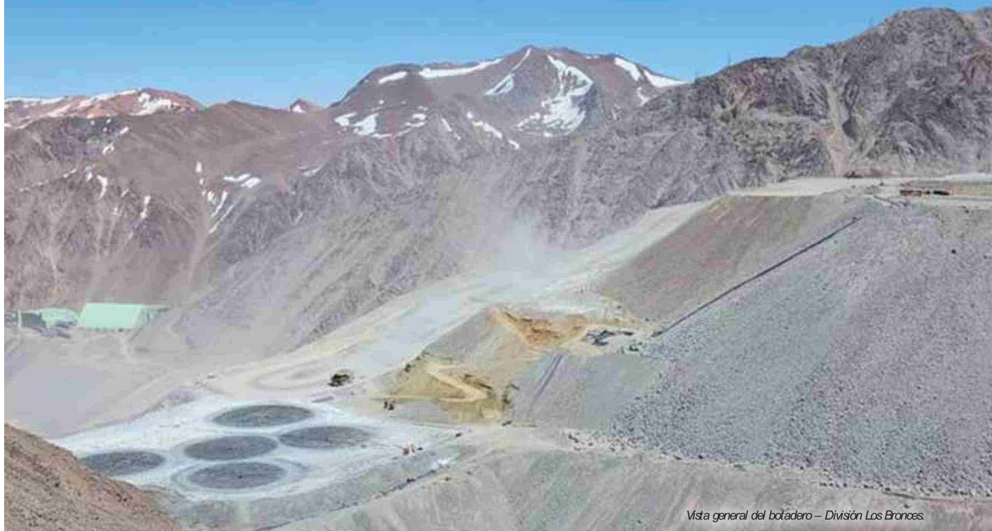
Vista general del botadero – División Los Bronces.

La implementación de una lógica operacional que integra metalurgia, control hidráulico y monitoreo en tiempo real está permitiendo alcanzar nuevos estándares de eficiencia en la lixiviación de cobre a 3.600 metros de altura.