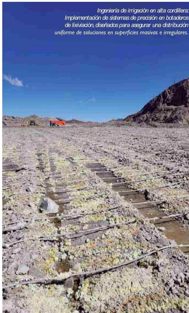
Ingeniería de irrigación en alta cordillera: Implementación de sistemas de precisión en botaderos de lixiviación, diseñados para asegurar una distribución uniforme de soluciones en superficies masivas e irregulares.

son extensos y requieren una planificación basada en datos históricos y en tiempo real.