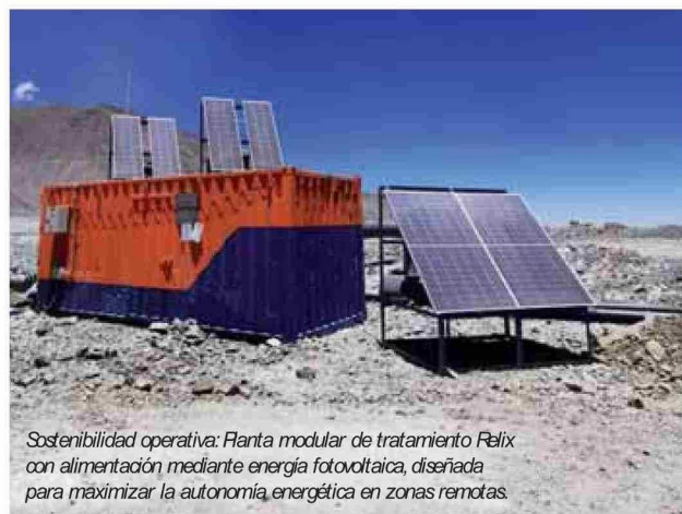
Sostenibilidad operativa: Planta modular de tratamiento Relix con alimentación mediante energía fotovoltaica, diseñada para maximizar la autonomía energética en zonas remotas.

El siguiente horizonte para Relix es la transición hacia modelos predictivos que anticipen el comportamiento del sistema mediante analítica avanzada. Esta capacidad de anticipación es crítica en lixiviación, donde los tiempos de respuesta del mineral