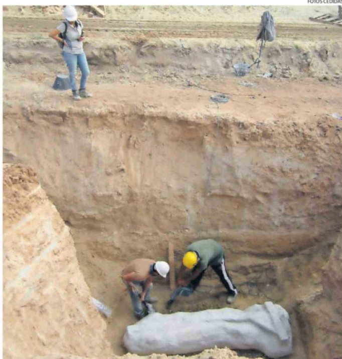
LA INVESTIGACIÓN USÓ ANTECEDENTES DE MONITOREOS A OBRAS EN COQUIMBO.