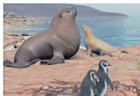
HABÍA MÁS FOCAS QUE LOBOS MARINOS Y GRANDES PINGÜINOS.

Así, confirmó que hasta hace 3 millones de años la temperatura del mar superficial del norte chileno era de unos 17,1 °C promedio, lo que es entre 3 y 4 grados más cálida que lo estimado durante el Pleisto-