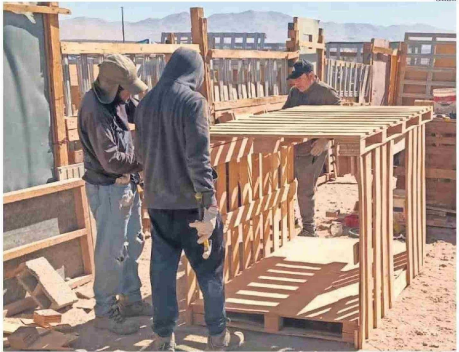
EL TRABAJO DE LOS PRIVADOS DE LIBERTAD SE REALIZA BAJO LA SUPERVISIÓN DE PERSONAL DE GENDARMERÍA EN CALAMA.