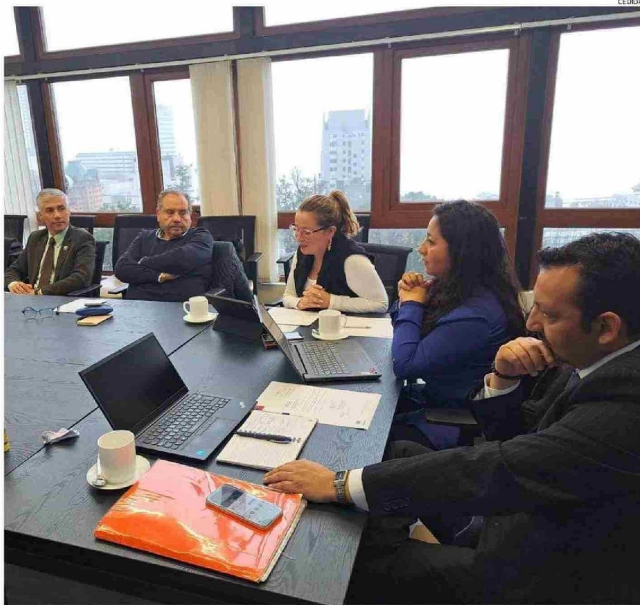
DURANTE LOS MESES DE MAYO Y JUNIO LOS CONSEJEROS REGIONALES REVISARÁN LOS PROYECTOS SECTORIALES QUE SE PROYECTAN PARA LA REGIÓN.

En materia de capacitación, el Sence Los Lagos entregó un listado de programas que serán priorizados durante el próximo año, tales como Reconversión Laboral, Certificación de Competencias Laborales, Intermediación Laboral, Formación en el Puesto de Trabajo, Capacitación en Oficios, Bono de Capacitación para Micro y Pequeños Empresarios, y Becas Fondo Cesantía Solida-