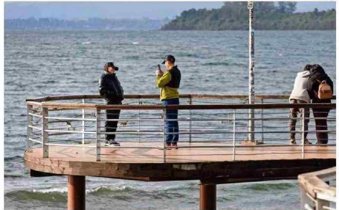
EN TURISMO SE PROMOVERÁN PROGRAMAS PARA TERCERA EDAD, TURISMO FAMILIAR Y GIRAS DE ESTUDIOS.