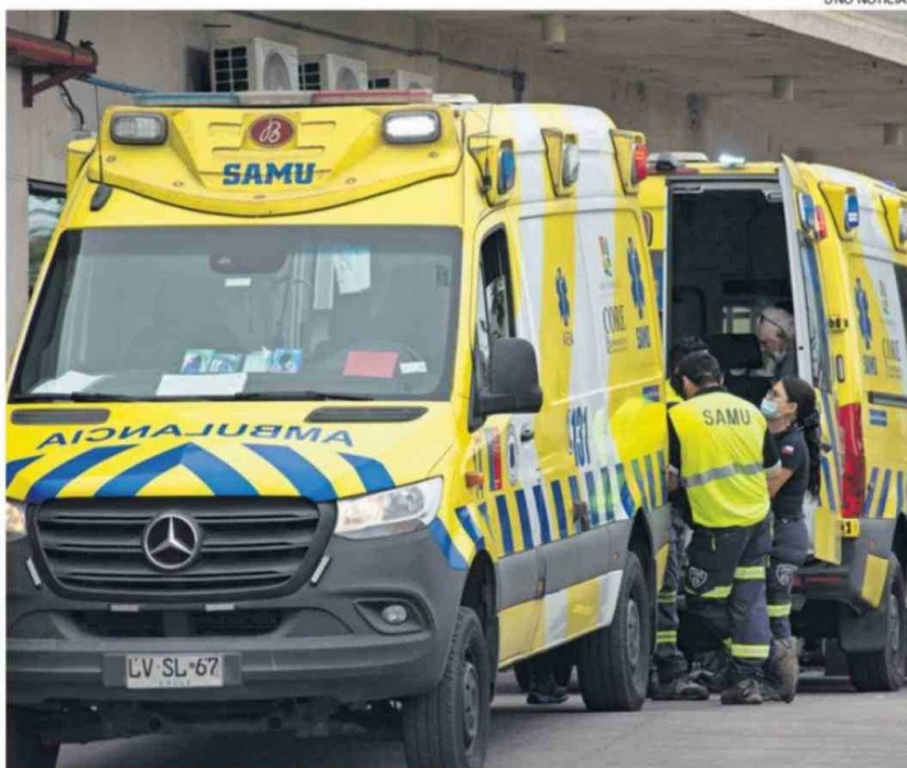
LA DIRECTORA DEL SERVICIO DE SALUD ASEGURÓ QUE ESTÁN EN PROCESO DE CUBRIR LA BRECHA.

"Cada nivel de atención coordina sus propios vehículos institucionales en el contexto de la atención habitual de cada dispositivo