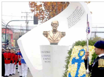
Hubo colocación de ofrendas florales al pie del monumento a Arturo Prat.