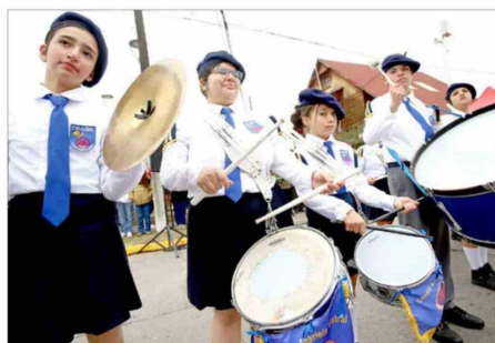
La Banda de Guerra del Colegio Gabriela Mistral desfiló con disciplina y marcialidad frente a las autoridades comunales.