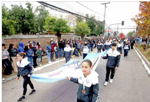
El Club Halterofilia pasó frente a las autoridades