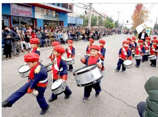
Con impecable presentación, párvulos del Colegio Los Pollitos dieron vida a una de las postales más tiernas del desfile.