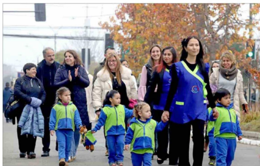
Con entusiasmo y orden, jardines infantiles de la comuna participaron de la tradicional ceremonia del 21 de mayo.

Sin duda, una de las postales más emotivas de la jornada la protagonizaron los estudiantes de los establecimientos educacionales municipales y subvencionados de Machalí, quienes desfilaron con impecable presentación, disciplina y entusiasmo frente a las autoridades y vecinos. Los aplausos del público acompañaron el paso de niñas, niños y jóvenes, quienes asumieron un rol protagónico en esta significativa conmemoración, transformando el acto en una verdadera muestra de formación cívica y memoria histórica. La jornada contó además con el tradicional esquinazo, donde el Conjunto Folclórico Inspiración Cuequera animó los pies de cueca, aportando identidad y folclor a una ceremonia cargada de