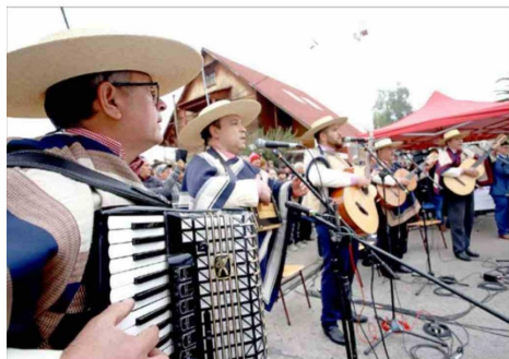
El Conjunto Folclórico Inspiración Cuequera puso música y tradición al esquinazo que animó la jornada patriótica.