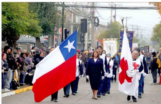
La Cruz Roja de Machalí se hizo presente en el desfile