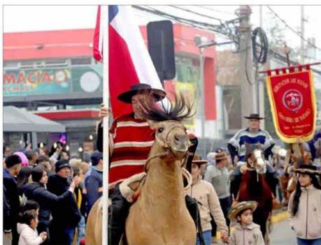
Clubes de huasos y crianceros realizaron las raíces y costumbres del mundo rural machalino.