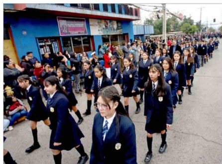
Estudiantes del Liceo Sn José de Machali destacaron por su gallardía y compromiso durante el desfile cívico.

Luego fue el turno de las organizaciones comunitarias, club adulto mayor Ucam, clubes de adulto mayor Esperanza, agrupaciones de apoyo social, establecimientos educacionales, entre ellos escuela Juan Tachoire Moena, Colegio San Joaquín de los Mayos, Colegio San José de Machali, Colegio Los Llanos, Colegio Diego Portales, Colegio Santa Teresa, Colegio Gabriela Mistral, Liceo de Machali, instituciones deportivas, agrupaciones folclóricas y representantes del mundo campesino y huaso.