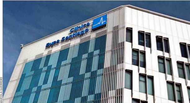
La clínica Bupa de Santiago es la más grande del grupo a nivel mundial.

"El objetivo nuestro es seguir creciendo. Si el vehículo es adquisiciones, o es crecimiento orgánico, o es construir, lo exploraremos en su minuto".