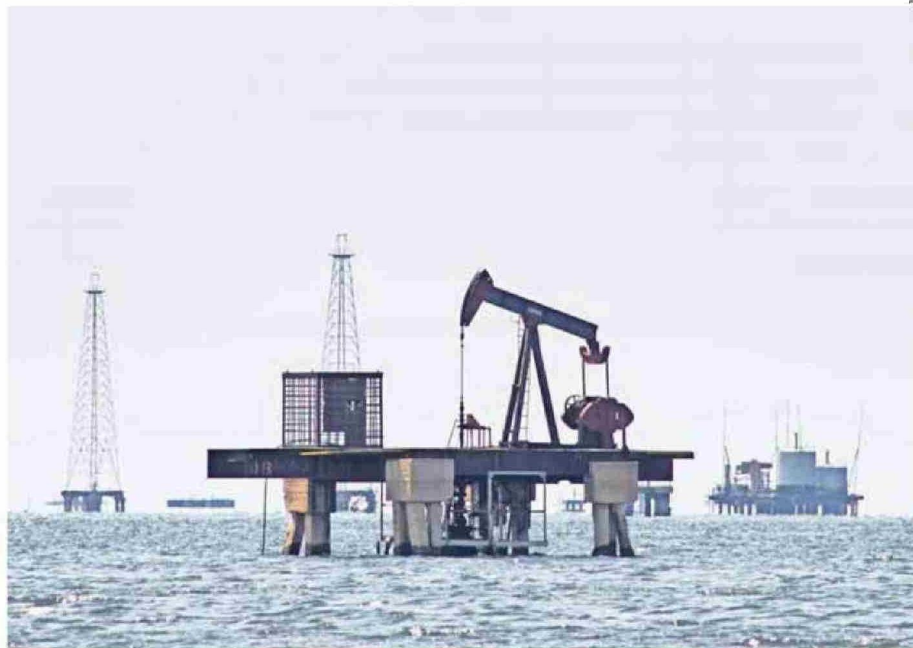
PLATAFORMA PETROLÍFERA ABANDONADA EN VENEZUELA. NO SÓLO ESTE RECURSO SERÍA EL QUE NECESITA ESTADOS UNIDOS.

Respecto de lo primero, mucha atención se ha puesto a las declaraciones del propio Presidente Trump acerca de que uno de los motivos de la acción sea el petróleo. Esta visión debe ser matizada. Es cierto que Venezuela cuenta con las mayores reservas de petróleo del planeta; pero son yacimientos con capital degradado y que requieren de inversiones que -según analistas del rubro- podrían demorar más de una década en incorporarse a la oferta mundial. Quizás más importante, y prácticamente eludido en los análisis sobre el tema, se encuentra el hecho de que Venezuela es también rico en minerales estratégicos. El país contiene depósitos de casiterita (dióxido de estaño), níquel, titanio, rodio, coltán y otros minerales raros que están emergiendo como insumos clave para industrias de alto valor y cadenas de suministro críticas a nivel global. Cuando se va al último reporte relativo a minerales críticos elaborado