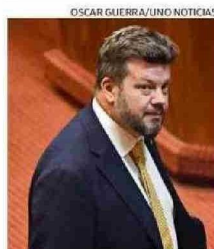
El diputado Johannes Kaiser.