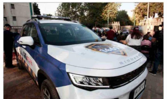
Las nuevas camionetas significaron una inversión de 400 millones de pesos, que fueron financiados por el Gobierno Regional de Santiago a través del Fondo Nacional de Desarrollo Regional (FNDR).