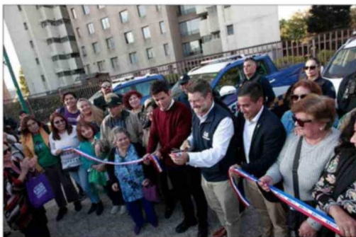
Claudio Orrego, gobernador de la Región Metropolitana y el alcalde Agustín Iglesias, acompañados del concejal Manuel Jara y vecinos de Independencia, realizan el tradicional corte de cinta que marca la entrega oficial de los vehículos a la comunidad.