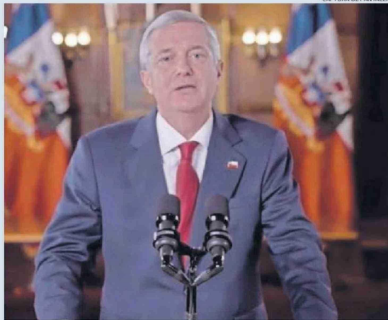
CAPTURA DE PANTALLA

El asunto fue corroborado por concejales, mientras el Municipio apuntó que los requerimientos de bomberos han bajado en los últimos meses. Pág. 3