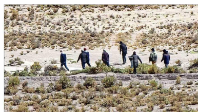
La medida que evalúa el Gobierno busca incentivar el regreso de extranjeros que entraron de manera irregular a Chile a sus países de origen.

ra adecuada". Añade que "no es (algo) tan distinto a lo que ya tenemos con los inmigrantes que vienen a trabajar a Chile de países con los que tenemos convenios y cuando retornan pueden retirar las cotizaciones que han hecho". Cifuentes complementa que actualmente "no hay convenios con tantos países, hay con Perú y Bolivia... Estos convenios que existen hace tiempo no han generado ninguna presión por retiros porque es algo que se entiende como razonable. Las personas son dueñas de esos ahorros y en la medida en que dejan de trabajar en Chile es razonable que esos ahorros los puedan retirar". Una opinión crítica respecto de