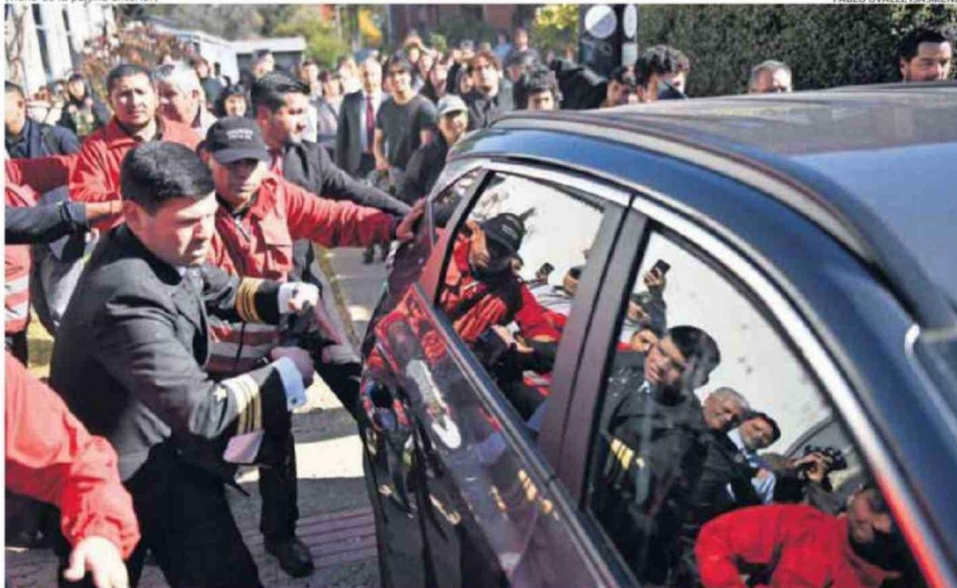
EN VALDIVIA, LA MINISTRA DE CIENCIA DEBÍO SALIR CORRIENDO MIENTRAS ERA GOLPEADA, EMPUJADA Y ROCIADA CON AGUA DE LA U. AUSTRAL.

tras palabras, el problema no es solo dónde ocurre la violencia, sino dónde el sistema tiene menos herramientas para responder. Los datos de la Agencia de Calidad de la Educación muestran que regiones como La Araucanía, Tarapacá y Atacama presentan sistemáticamente menores niveles en indicadores de clima de convivencia escolar, mientras que otras como la Región Metropolitana o Biobío, aun cuando concentran un alto volumen de casos, exhiben mejores resultados relativos en gestión de la convivencia y capacidades institucionales. Esta brecha podría estar asociada a diferencias en disponibilidad de equipos psicosociales, redes de apoyo y capacidad de gestión escolar.