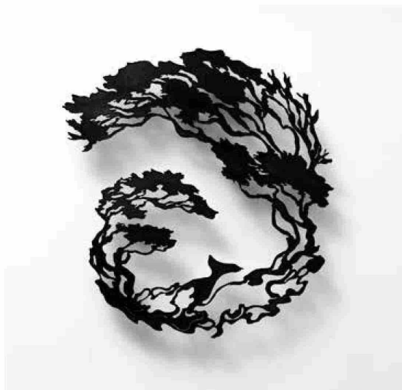
«San Isidro» Plancha de acero calada a mano con la técnica de corte por plasma (2025).