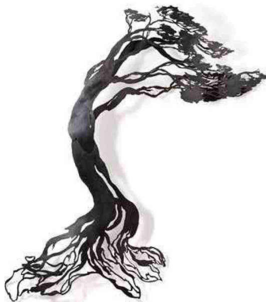
«Nothofagus Antártica» Plancha de acero calada a mano con la técnica de corte por plasma (2025).