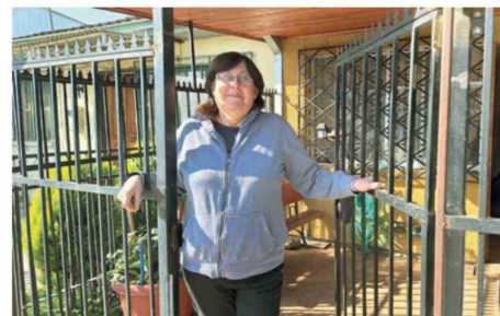
La familia Mardones es de las antiguas que queda en la Costanera.

los dice que el municipio les ha pedido regularizar algunas situaciones, las que creían haber solucionado. Pero no. El asunto sigue pendiente.