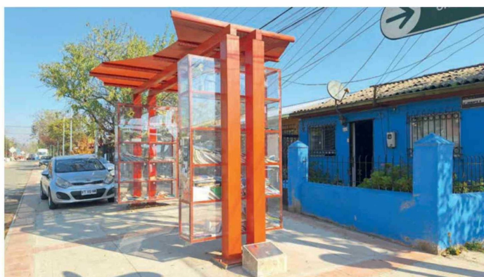
Una biblioteca de paso le da un toque distinto al pasaje dos.

Un par de señoras en el pasaje dos hablan con un maestro en la puerta de la casa. Les pregunto si podemos hablar. Me dicen que mejor vaya donde los