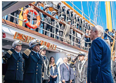
El Presidente José Antonio Kast visitó el buque escuela "Esmeralda", en la artesanal del anuncio de la iniciativa.

El cambio de estrategia es directamente atribuido a la dupla política de La Moneda: los mi-