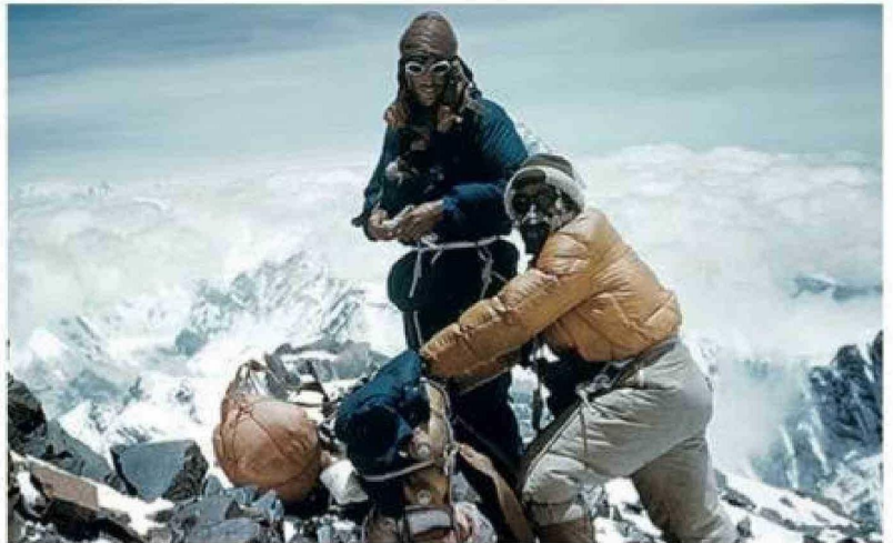
Al llegar al techo del mundo se quitaron las máscaras de oxígeno.