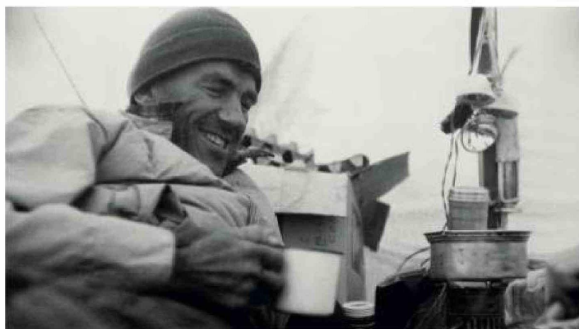
Antes de convertirse en uno de los primeros hombres en alcanzar la cima del Everest junto al sherpa Tenzing Norgay en 1953, Edmund Hillary fue apicultor.

que Edmund recibiera una muy buena educación, sin importarle el trayecto que debía recorrer a diario en tren y bicicleta de una hora, cuarenta minutos, de ida y otros tantos de vuelta. Eso implicaba que debía levantarse muy temprano y regresar a las seis de la tarde. Edmund sostuvo esa rutina a lo largo de 3 años y medio, que se traducía también en una ausencia de actividades extraescolares por falta de tiempo y tiempo compartido con sus compañeros. Es muy probable que esa disciplina haya moldeado su carácter.