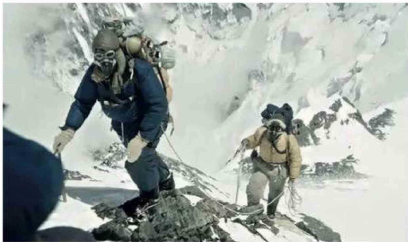
Edmund Hillary junto a Tenzing Norgay, el sherpa que lo acompañó hasta la cima, una figura decisiva para la hazaña de 1953.

tuvo lejos de ser una marcha triunfal. Cargaban cansancio acumulado, frío intenso y un equipamiento que hoy parecería primitivo. A pocos metros de la cima se toparon con una barrera de roca y hielo casi vertical que parecía cerrarles el paso. Aquel obstáculo —el legendario Escalón Hillary— concentró el momento más crítico de toda la ascensión.