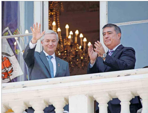
El Presidente electo, José Antonio Kast, visitó ayer al alcalde de Santiago, Mario Desbordes.

Así, el diseño se enfocó en las figuras centrales del Gobierno. Mientras Elizalde planteó que a