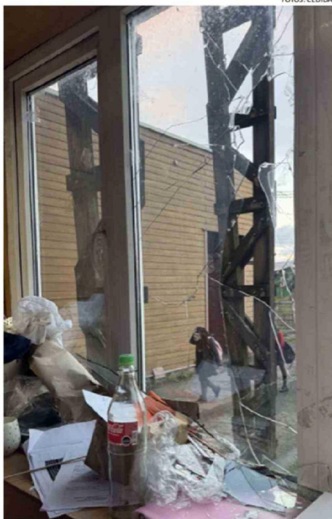
DAÑOS EN UNO DE LOS VENTANALES DEL LICEO POLITÉCNICO.

Bajo este escenario, desde el sostenedor decidieron sumarse a la investigación