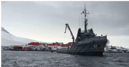
El Remolcador de Alta Mar Lautaro, recorriendo los canales australes y el Territorio Chileno Antártico.