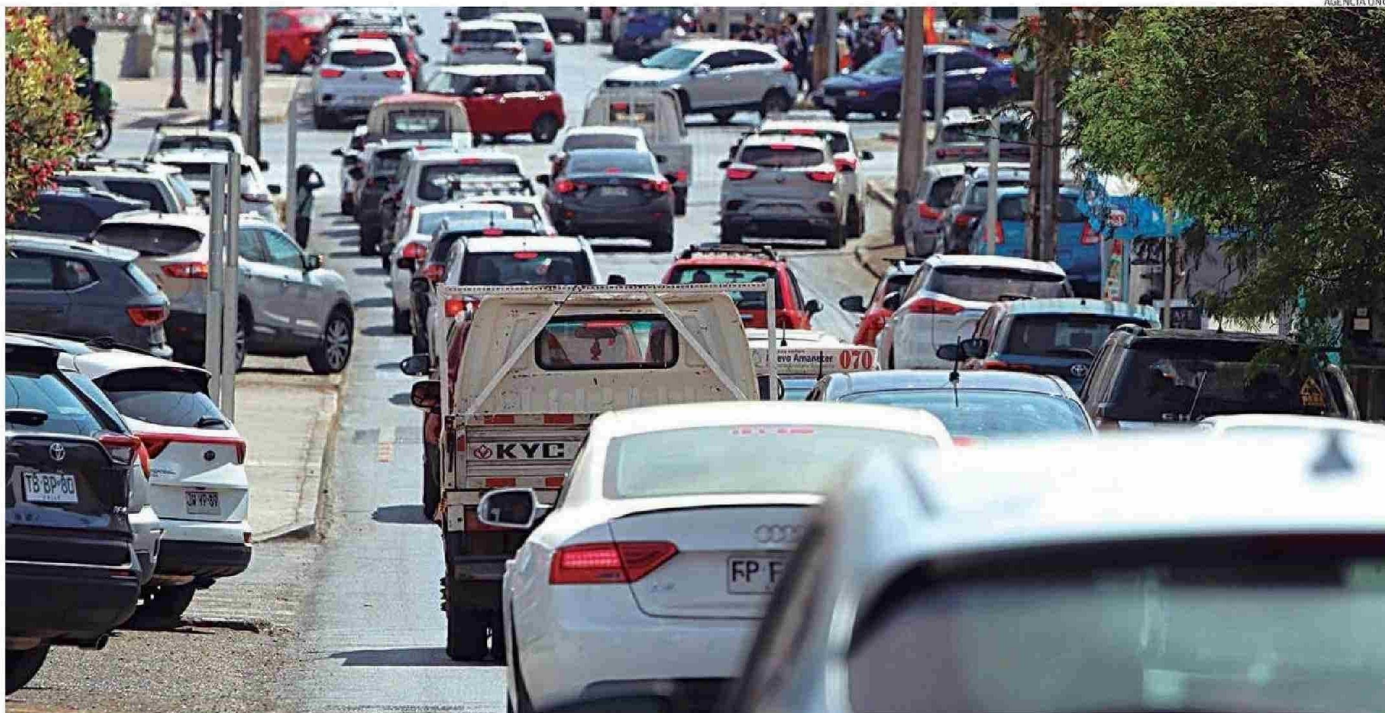
LAS OBRAS DE LA COSTANERA SUR SUMAN MÁS DE CUATRO AÑOS GENERANDO UNA SERIE DE DIFICULTADES EN VECINOS Y LOCATARIOS DEL SECTOR.