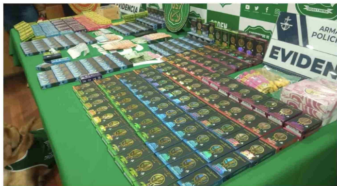
Gran cantidad de cartridges de hachís, ketamina y otros productos químicos, de dudosa procedencia y venta ilegal, fueron incautados en el procedimiento.

“Esta es una investigación que nace ya aproximadamente hace 4 meses, a raíz de una incautación que hicimos en una embarcación”