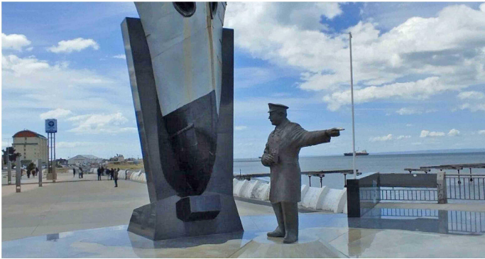
Monumento a Piloto Pardo, héroe del rescate de Shackleton en costanera de Punta Arenas.

Tiraje: 5.200 Lectoría: 15.600 Favorabilidad: No Definida