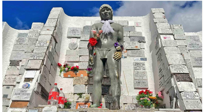
Tumba "Indio desconocido", Cementerio Municipal Sara Braun.

El pie que trae suerte y otras historias