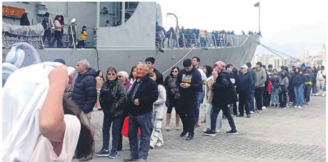
El público debió hacer una larga fila para poder abordar la fragata Capitán Prat.

El oficial naval explicó que, si bien, están acostumbrados al alto interés que despiertan los buques de la Armada en todo el país, estas jornadas suelen realizarse en fines de semana. Al tratarse