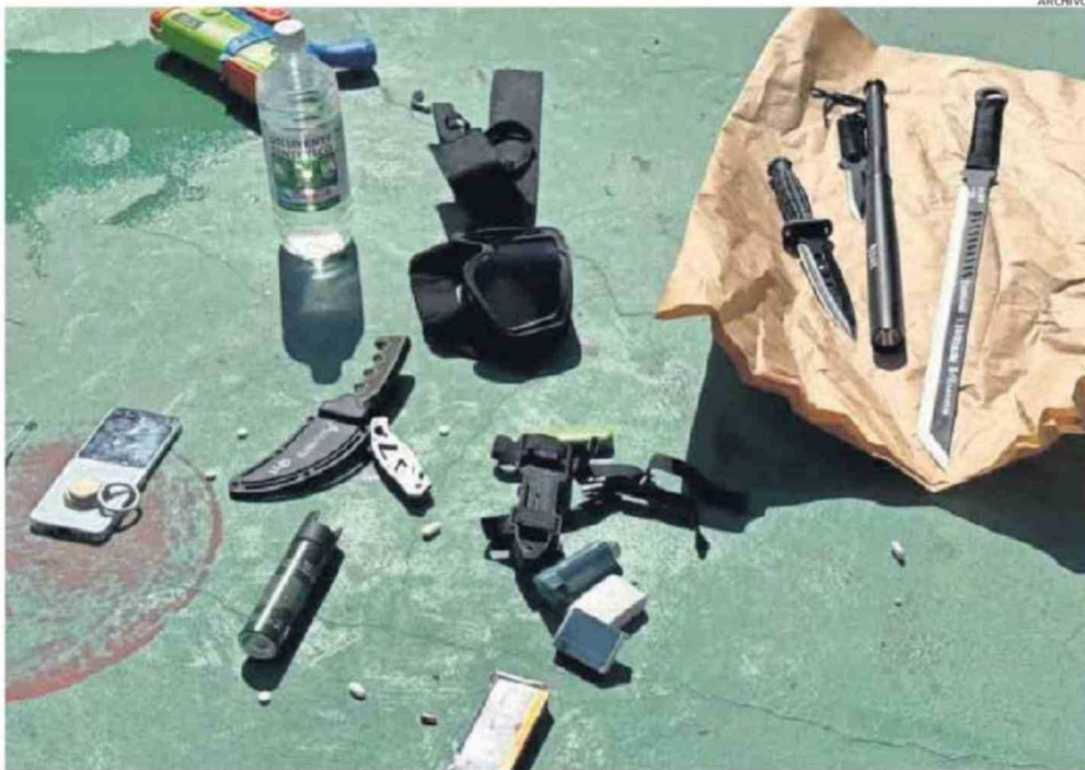
EN LA AUDIENCIA EL MINISTERIO PÚBLICO DETALLÓ QUE EL JOVEN HOMICIDA ACTUÓ CON PREMEDITACIÓN Y PLANIFICACIÓN DE LOS ATAQUES.

VIENE DE LA PÁGINA ANTERIOR nto se preparó en un baño, poniéndose una capucha, antiparras y una máscara. Al salir con el objetivo de atacar a los niños más pequeños, se encontró con una funcionaria de iniciales M.V.R.V (59 años), a quien roció con gas pimienta para luego atacarla por la espalda con un arma cortopunzante de doble filo. La víctima sufrió heridas cortopunzantes profundas que le causaron la muerte en pocos minutos, y posterior a ello procedió a perpetrar los siguientes ataques”, prosiguió el fiscal Peña.