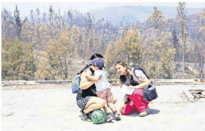
LAS MADRES Y SUS HIJOS SON OBJETO DE ESPECIAL CUIDADO POR PARTE DEL PERSONAL DE SALUD.

E quipos del Servicio de Salud Concepción se encuentran desplegados en terreno, prestando atención de salud a los habitantes de la provincia de Concepción afectados por el gran incendio. El operativo incluye a equipos de Psicotrauma, el PAP Móvil y atención sanitaria en el sector Trigal de Florida.