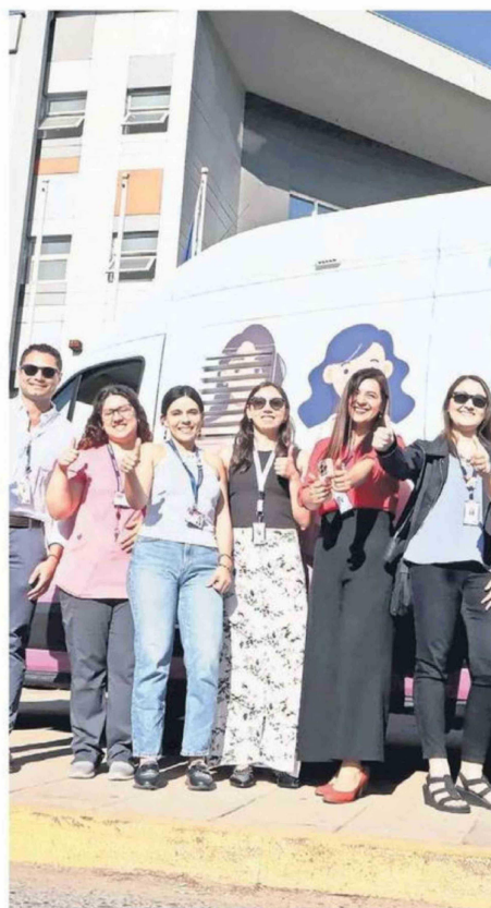
PORTE DEL EQUIPO DE SERVICIO DE SALUD QUE ORGANIZA.