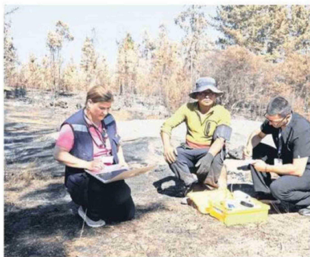
EL TRABAJO SE REALIZA EN PAISAJES DESTRUIDOS POR EL FUEGO.